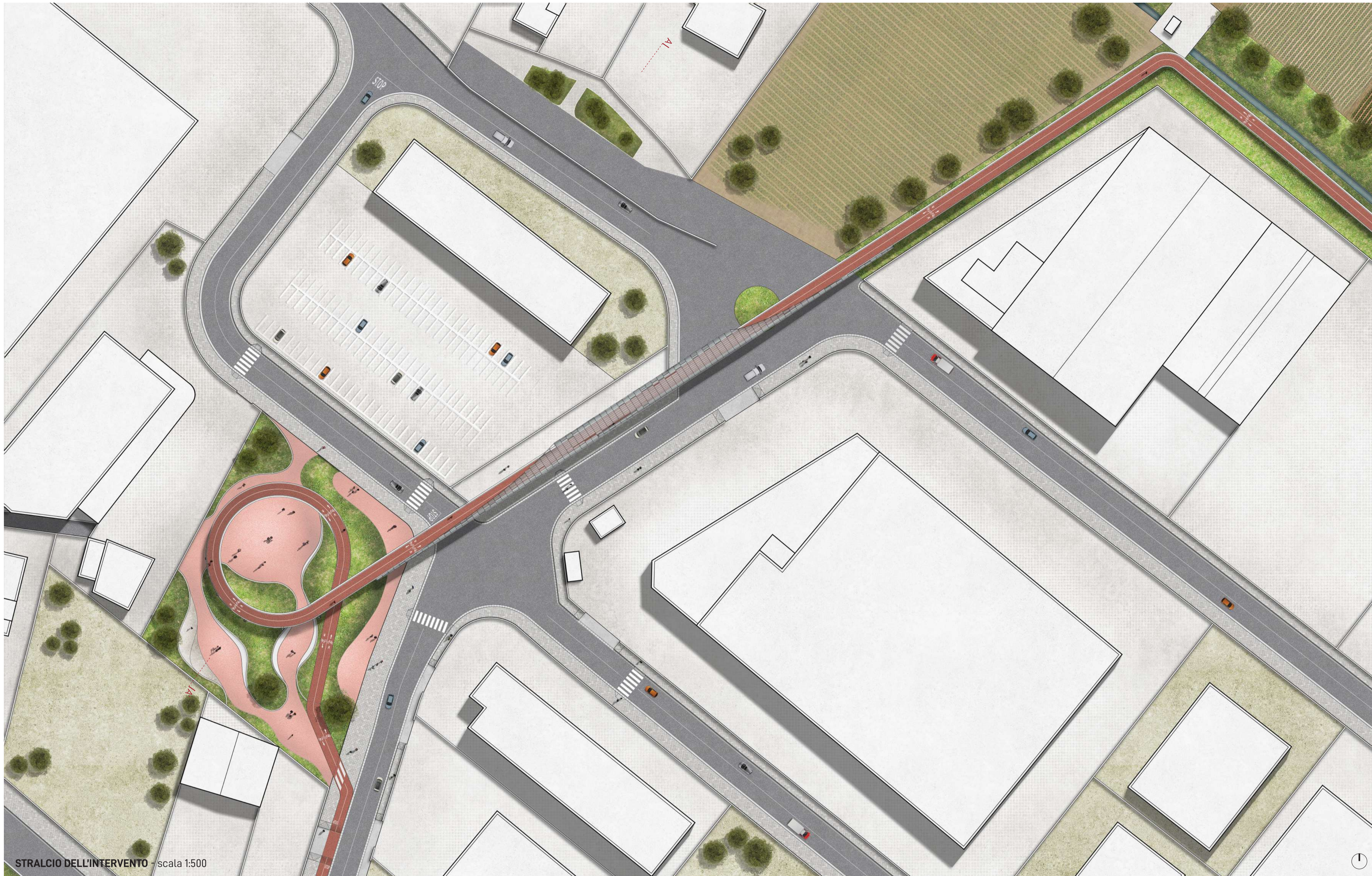
STRALCIO DELL'INTERVENTO - scala 1:500