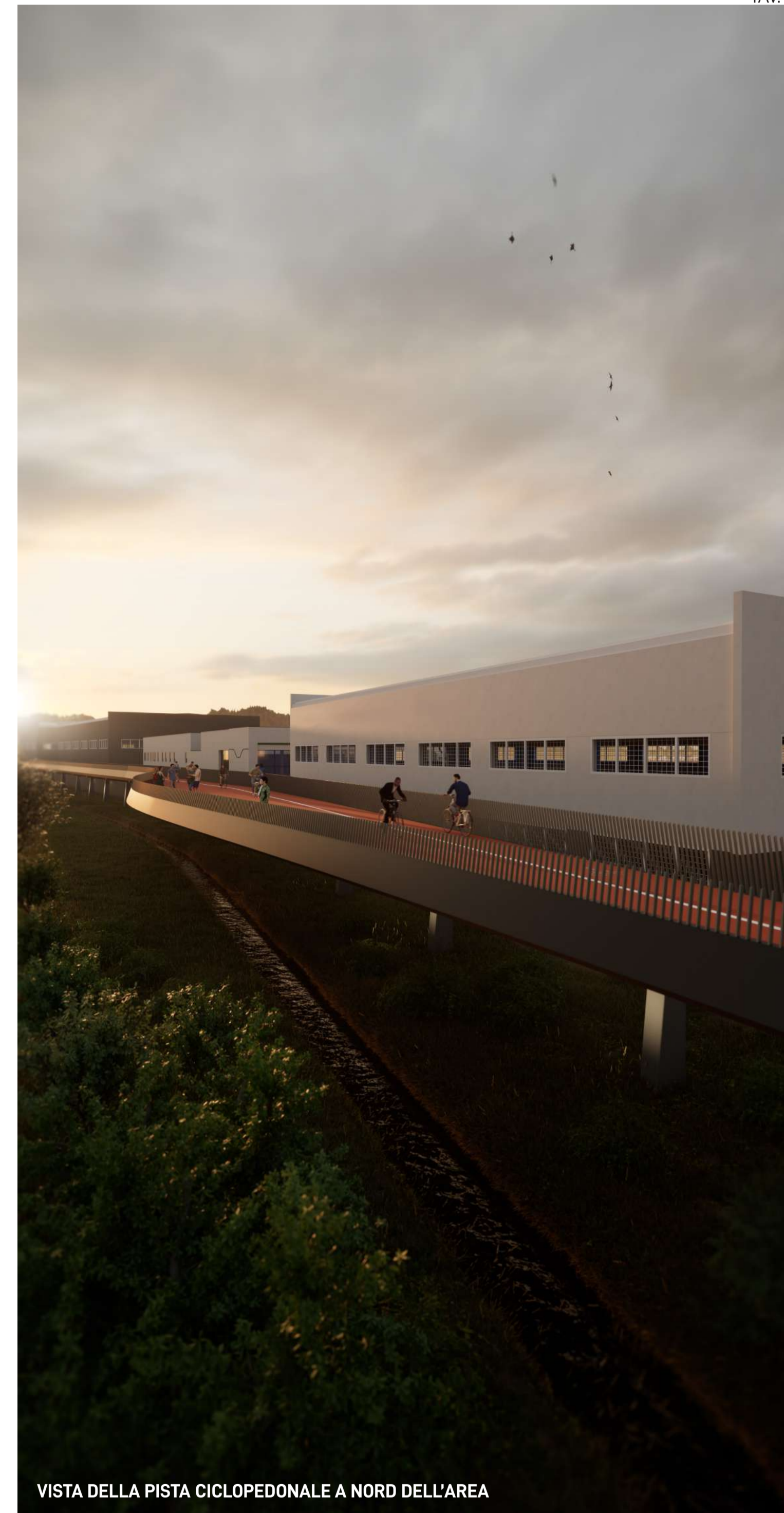
VISTA DELLA PISTA CICLOPEDONALE A NORD DELL'AREA