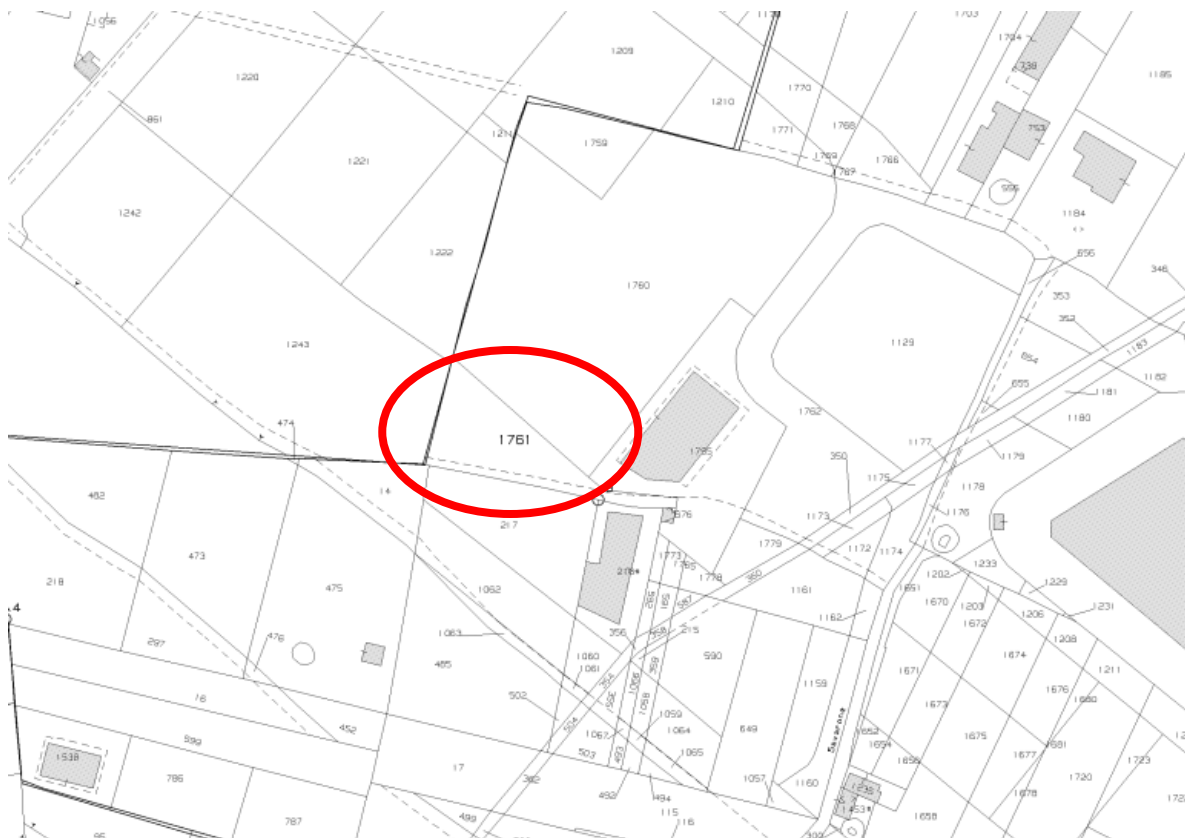
Figura 1 - Estratto di Mappa Catastale