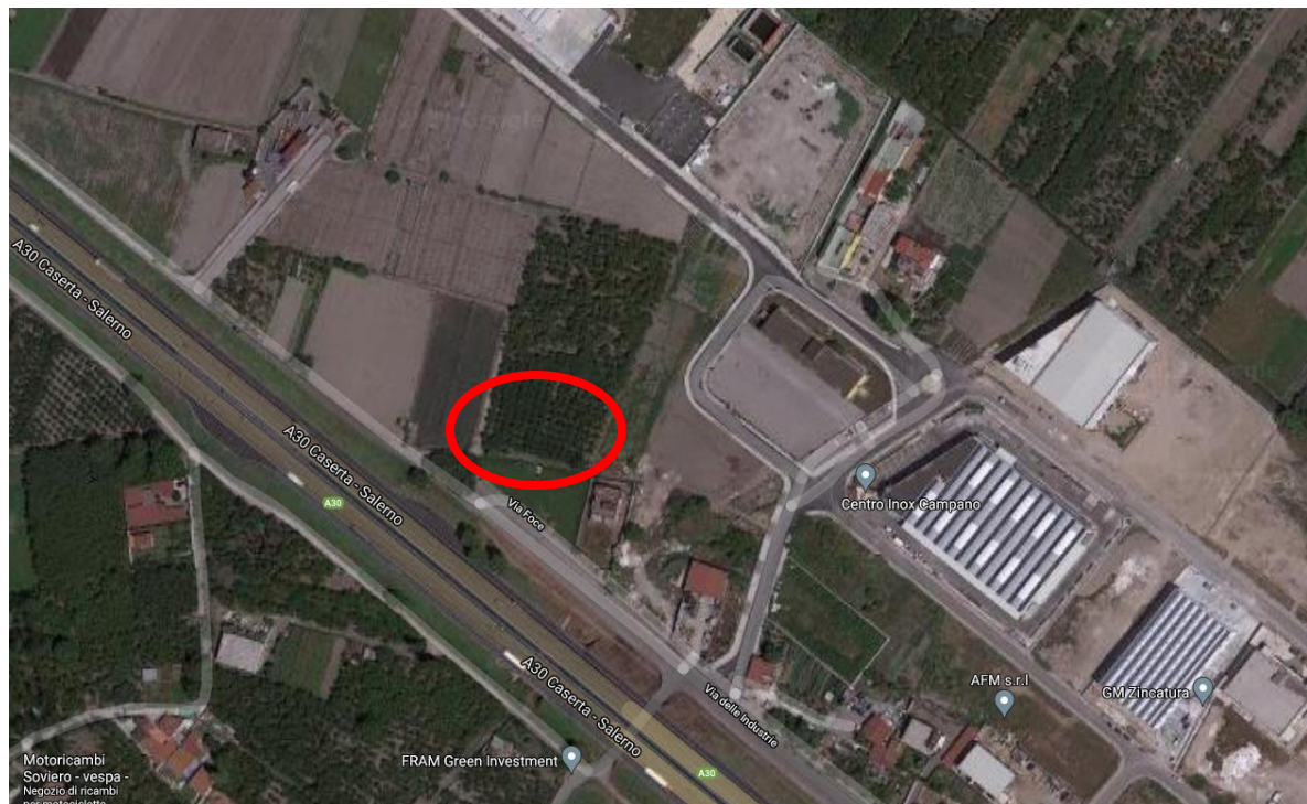
Figura 2 - Foto aerea da Google Maps